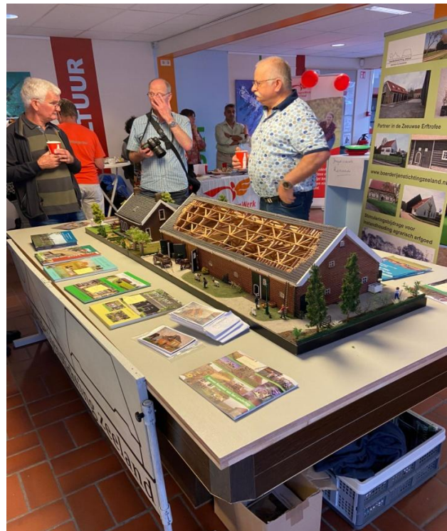
schaalmodel Zeeuwse boerderij