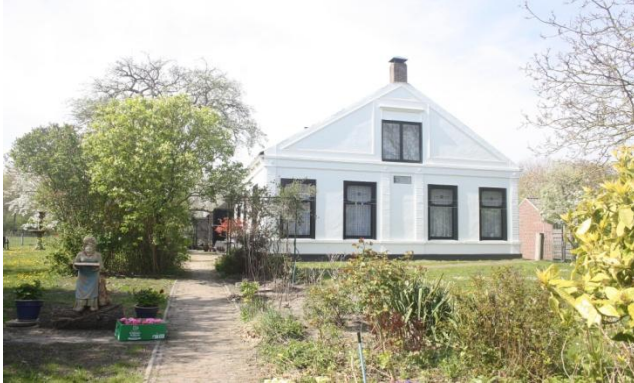
Witte Hoeve Ovezande

Naast de 15 geselecteerde staan er ook een aantal op een reservelijst die misschien na een eventuele volgende subsidieronde kunnen worden aangepakt. Ook kan het zijn dat er een boerderij toch weer af valt zodat er een van de reservelijst kan worden toegevoegd.