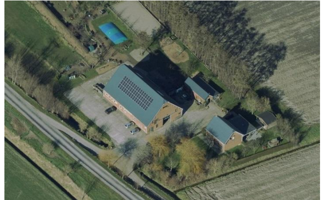
Luchtfoto winnaar Erftrofee

Op 26 september 2020 was het eindelijk zo ver en vond de uitreiking plaats van de Zeeuwse Erftrofee door de Boerderijen-stichting.